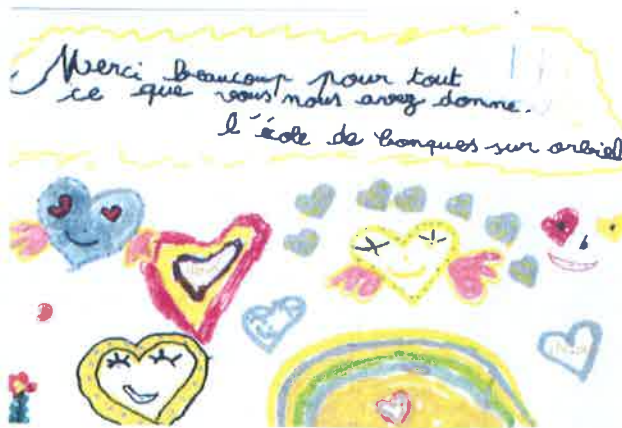
Dessins réalisés par les enfants de Conques sur Orbiel

Remerciements à Naïs pour l'accomplissement de sa mission.